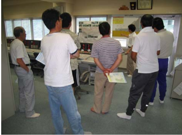
H20.07.06 会津坂下町 矢ノ目地区 (農地・水)